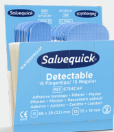
Salvequick Blue Detectable Mix Fingertip/Regular REF 6754CAP Art. nr. 272297

För känslig hud. Varje refill innehåller 43 plåster (27 st 72 x 19 mm och 16 st 72 x 25 mm). 6 refiller/ask.