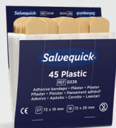
Salvequick Plastplåster REF 6036 Art. nr. 272293

Varje refill innehåller 45 plåster (27 st 72 x 19 mm och 18 st 72 x 25 mm). 6 refiller/ask.