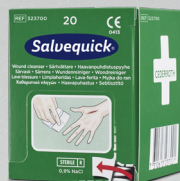
Salvequick Sårsvättare REF 323700 Art. nr. 200725

Steril, fysiologisk koksaltlösning, styckförpackade. Passar Första Hjälpstationen.