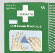
Cederroth Soft Foam Bandage Blue REF 676100 Art. nr. 212204

Ger snabb avkylning och effektiv smärtlindring vid brännsår och solbränna. Cederroth Burn Gel kylar lika effektivt som ljummet vatten och påskyndar därmed läkningsprocessen.