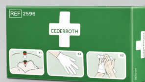
Cederroth skyddspaket REF 2596 Art. nr. 200879

Minskar risken för kontakt mellan hjälpare och skadad. Innehåller andningsmask med backventil, 2 par handskar och 2 st Cederroth Safety Hand Cleaners.