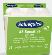
Salvequick Sensitive Plåster Non-woven REF 6943 Art. nr. 272294

Varje refill innehåller 21 plåster (14 st 80 x 30 mm och 7 st 80 x 60 mm). 6 refiller/ask.