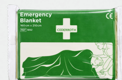
Cederroth Räddningsfilt REF 1892 Art. nr. 210668

Sterila, extra mjuka och följsamma. Detekterbara i de flesta metalldetektorer som används inom livsmedelsindustrin. Varje refill innehåller 35 sterila plåster (21 st 72 x 19 mm och 14 st 72 x 25 mm). 6 refiller/ask.