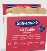
Salvequick Textilplåster REF 6444 Art. nr. 272291

Varje refill innehåller 40 plåster (24 st 72 x 19 mm och 16 st 72 x 25 mm). 6 refiller/ask.