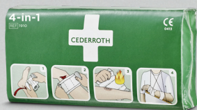
Cederroth 4-in-1 Blodstoppare REF 1910 Art. nr. 200758

Sterilt universalförband med 4 funktioner: Tryck-, stöd-, täck- och brännskadeförband.