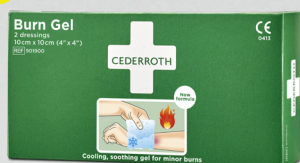
Cederroth Burn Gel Dressing REF 901900 Art. nr. 416048

Ger snabb avkylning och effektiv smärtlindring vid brännsår och solbränna. Cederroth Burn Gel kylar lika effektivt som ljummet vatten och påskyndar därmed läkningsprocessen.