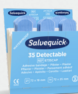
Salvequick Blue Detectable REF 6735CAP Art. nr. 272296

Sterila, extra mjuka och följsamma. Detekterbara i de flesta metalldetektorer som används inom livsmedelsindustrin. Varje refill innehåller 30 sterila plåster (15 st 66 x 39 (22) mm och 15 st 72 x 19 mm). 6 refiller/ask.