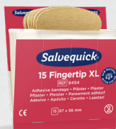
Salvequick Fingertoppsplåster REF 6454 Art. nr. 272295

Varje refill innehåller 40 plåster (24 st 72 x 19 mm och 16 st 72 x 25 mm). 6 refiller/ask.