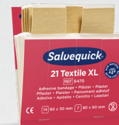
Salvequick Extra stora Textilplåster REF 6470 Art. nr. 272292

Varje refill innehåller 15 plåster (87 x 56 (23) mm). 6 refiller/ask.